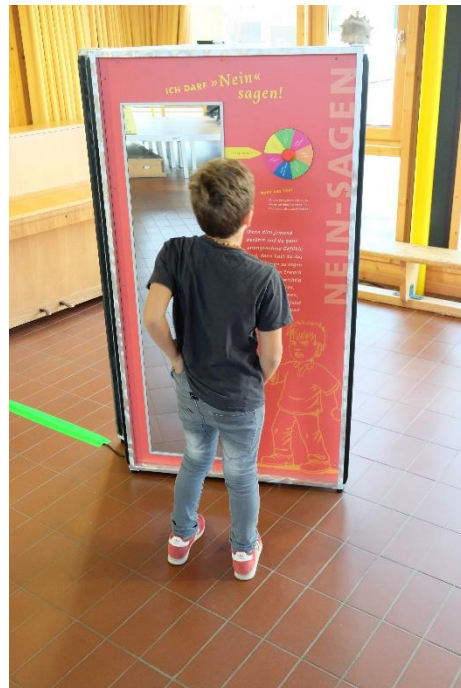
“Echt Klasse” - Projekt